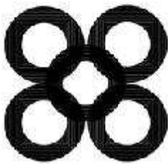
Sistema de estabilización de pilas (vista superior)