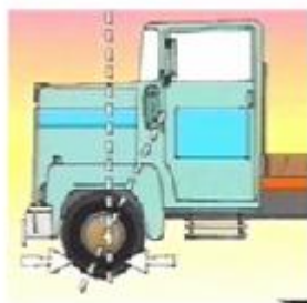
Ángulo de avance

La función de la inclinación transversal del pivote de dirección es reducir el esfuerzo de la dirección en las maniobras de estacionamiento y disminuir la repercusión de los recorridos irregulares en el volante. Si el ángulo de inclinación no estuviera de acuerdo con las especificaciones, se modificará la geometría del sistema de dirección y cambiará también el ángulo de avance.